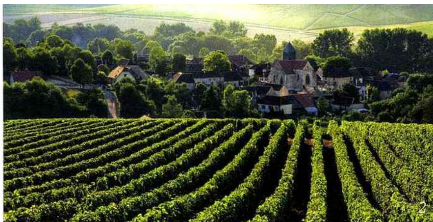
1. Chai du château La Dominique, à Saint-Émilion. 2. La Côte des Bar, en Champagne. 3. Bar éphémère Jaboulet, au sommet de la colline de l'Hermitage.

au château. Plus au Nord, en Bourgogne, Youri Lebault a lancé son Gold Tour proposant dégustations et rencontres d'exception tandis que Nantes a inventé le concept du « viti-break », entre ville et vigne. Grand classique pré-dégustation ? Une balade insolite à bord d'une Bentley (Beaujolais), d'un solex (Angers), d'un 4 x 4 (Pic Saint-Loup), d'un segway (Aube) voire d'une montgolfière (Alsace, Bourgogne, Charente-Maritime...). Plus atypique, on peut siroter un verre de côtes-du-rhône ou du Vivarais dans les grottes de Saint-Marcel, de Chauvet ou de l'Aven-d'Orgnac, en Ardèche, ou encore opter pour une pause méditation (Val-de-Loire, Pays de l'Hermitage et du Tournonais...), un marathon dans les ceps ou un pique-nique festif (Costières de Nîmes). Pour des séjours enivrants. A.F. Pour en savoir plus : www.visitfrenchwine.com